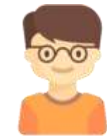
2 e enfant 10 $ de rabais

Les enfants d'une même famille, résidant à la même adresse, bénéficieront d'un rabais familial sur les inscriptions faites avant le 1er mai 2023 ( tous les enfants doivent être inscrits sur la même facture ).