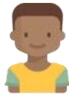
3 e enfant 15 $ de rabais