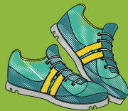
Souliers de course fermés