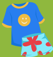
Vêtements de rechange (au besoin)