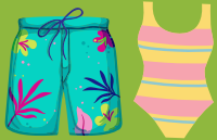
Maillot de bain