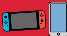
Jeux électroniques et téléphones