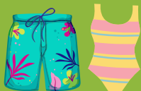
Maillot de bain