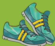
Souliers de course fermés