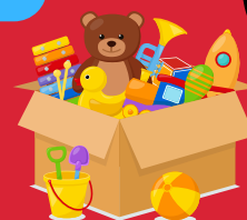
Jouets de la maison