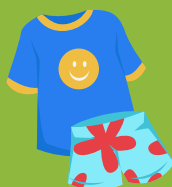
Vêtements de rechange (au besoin)